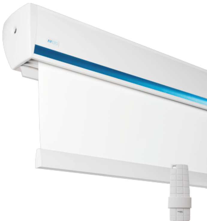
WYPOSAŻENIE PODSTAWOWE: RADIOWY PILOT STEROWANIA