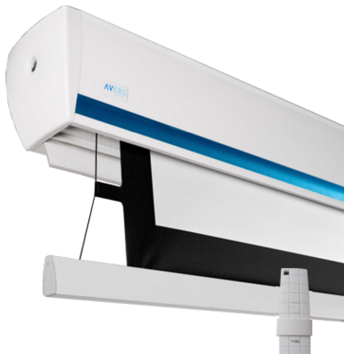
WYPOSAŻENIE PODSTAWOWE: RADIOWY PILOT STEROWANIA