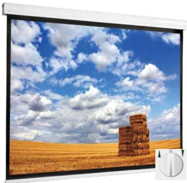
WYPOSAŻENIE PODSTAWOWE: PRZEŁĄCZNIK