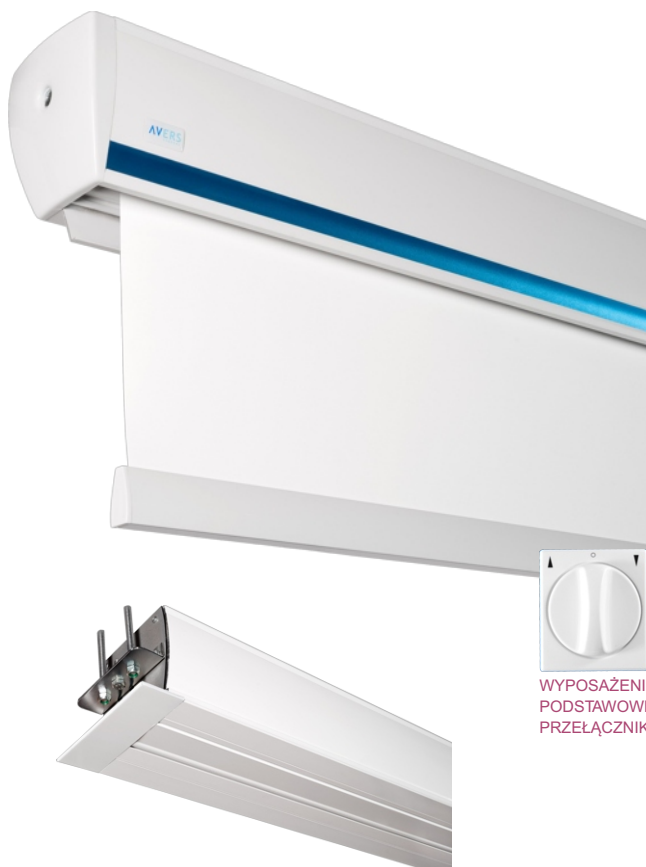
WYPOSAŻENIE PODSTAWOWE: PRZEŁĄCZNIK