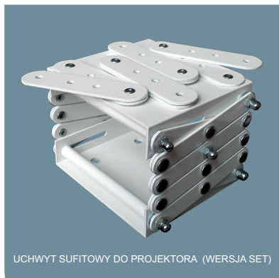
UCHWYT SUFITOWY DO PROJEKTORA (WERSJA SET)