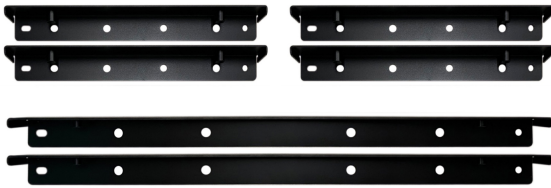
MOUNTING BRACKETS KIT